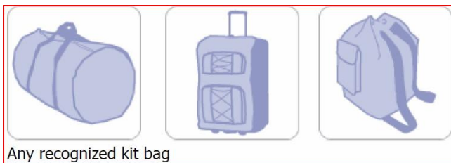
Any recognized kit bag