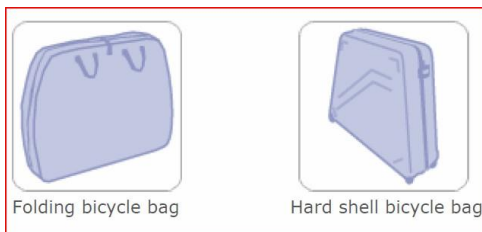
Folding bicycle bag